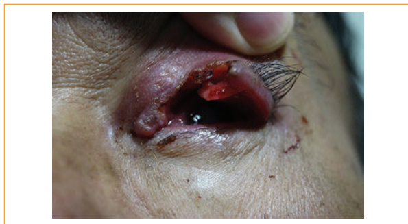
Figura 1. Vista de frente, se aprecia lesión ulcerada con bordes irregulares y pérdida de la arquitectura palpebral superior.

Paciente varón de 68 años de edad que presenta en la órbita izquierda una lesión ulcerada, con bordes irregulares y pérdida de la arquitectura del tercio medio a interno del párpado superior (Fig. 1), observándose madarosis en el área del borde libre palpebral de dicha lesión (Fig. 2), córnea con edema sectorial superior, con